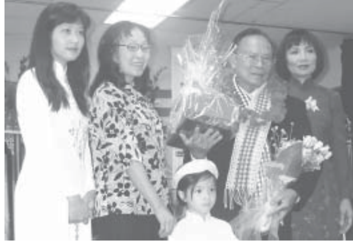
Độc giả ái mộ