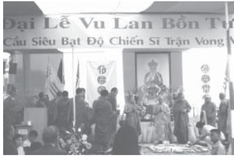
Lễ Đãi Táng do HT Thích Giác Lượng chủ trì nổi bật nghi thức nói trên trong ngày Đại lễ Vu Lan qua theo truyền thống Phật Giáo.