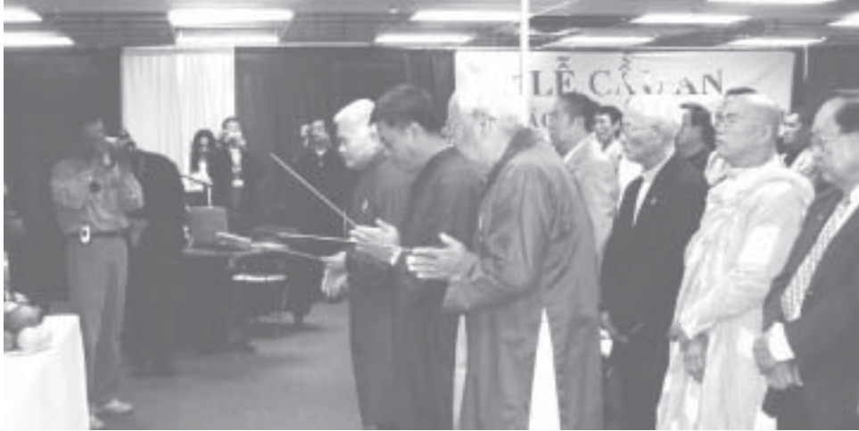
Các lãnh đạo tôn giáo, đại diện đoàn thể, nhân sĩ