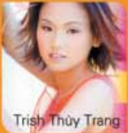
Trish Thùy Trang