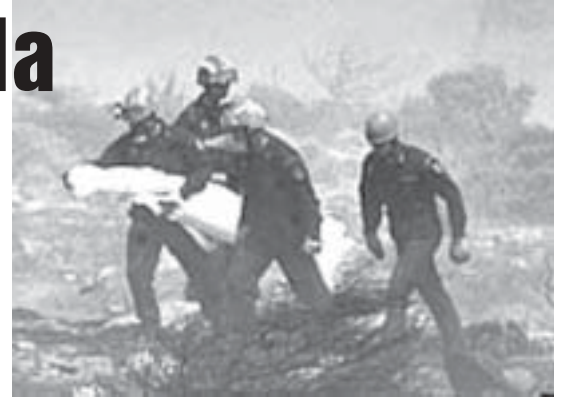
Toàn cấp cứu tìm thấy xác người 'đồng cứng'

Vụ tai nạn máy bay ở Hi Lạp khiến người ta bắt đầu quan tâm hơn đến các trường hợp được gọi là "máy bay ma".