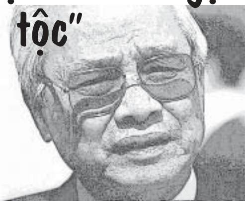
Về chính trị nhưng lại không đủ chất lượng trong quản lý và xây dựng."

(BBC) 29.08.2005. Cựu thủ tướng CSVN, ông Võ Văn Kiệt, thừa nhận Việt Nam sau 1975 đã có cách nhìn hẹp hòi, phân biệt thắng - thua, và kêu gọi có đại đoàn kết dân tộc. Trong bài viết cho báo điện tử VietNamNet nhằm đóng góp ý kiến trước Đại hội Đảng CSVN lần thứ 10, Võ Văn Kiệt nhắc đến chủ trương thời kỳ đầu 1945 khi chính phủ Hồ Chí Minh "xóa bỏ mọi hận thù và chia rẽ do chế độ cũ để lại, sẵn sàng thu dụng những người có tài, có năng lực, có tâm huyết, mà không kể đến quá khứ." Ông nói thêm "tiếc rằng một số năm sau đó, tư tưởng đại đoàn kết đã bị coi nhẹ, quan điểm giai cấp đã được vận dụng một cách máy móc, một chiều."