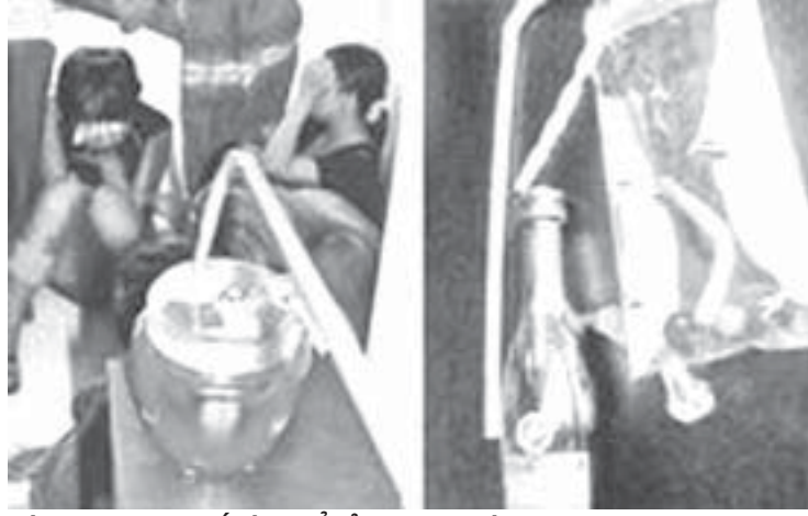
Các dụng cụ tự chế dùng để sử dụng ma túy

Một “đàn lắc” cho biết, vào thời điểm này, khi các “ổ lắc” liên tục bị phá, thì trong giới này xuất hiện một khái niệm mới về 2 chữ “Bản lĩnh”. Với họ, “Bản lĩnh” của những “Đàn chơi” hiện nay là