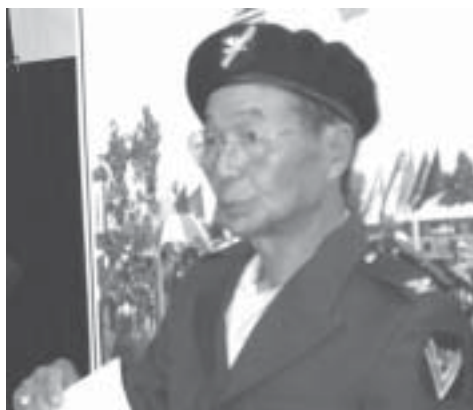
Đại tá Lữ Đoàn Phó LD 91 đọc lệnh bổ nhiệm