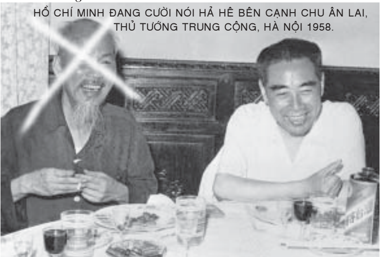
HỒ CHÍ MINH ĐANG CƯỜI NÓI HẢ HỀ BÊN CẠNH CHU AN LAI, THỦ TƯỚNG TRUNG CỘNG, HÀ NỘI 1958.

Ngày ông làm Thủ Tướng, ông cũng chỉ biết im lặng thi hành những gì Đảng