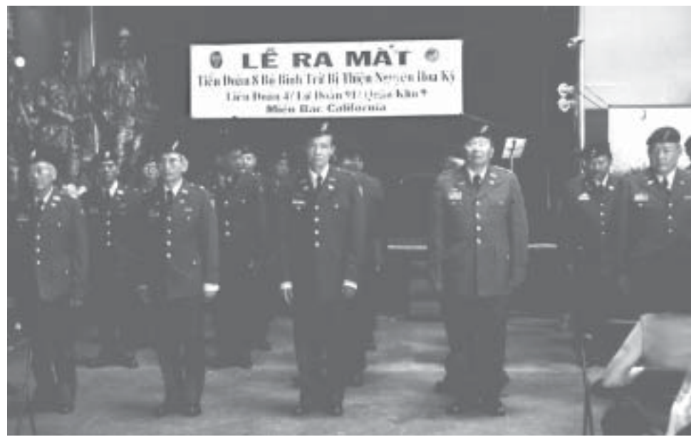
Lễ chào cờ