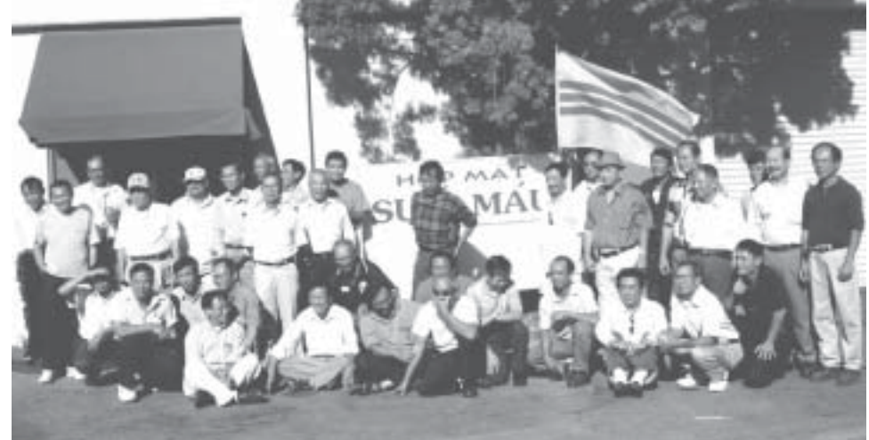
Những cựu tù Suối Máu