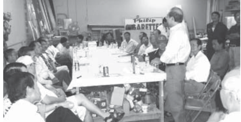
Những cựu tù Suối Máu