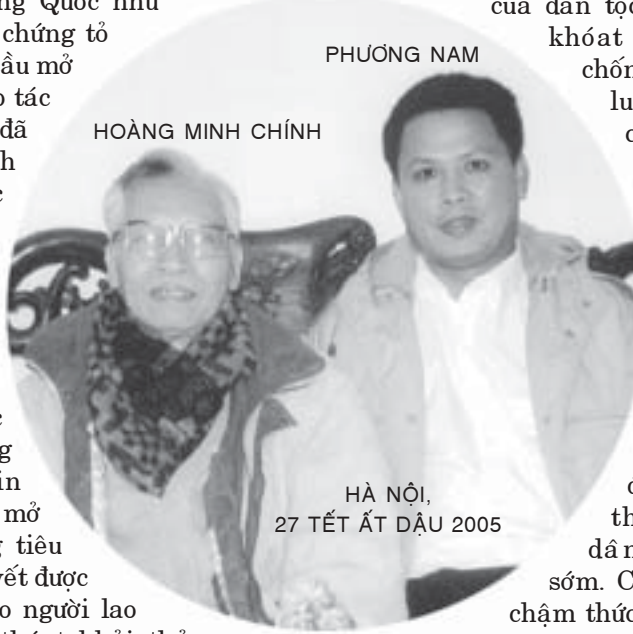
PHƯƠNG NAM HOÀNG MINH CHÍNH HÀ NỘI, 27 TẾT ẤT DẬU 2005

Ngày xưa theo truyền thuyết, cha con nhà An Dương Vương vì mất cảnh giác nên đã vô tình để mất nước ta vào tay cha con nhà Triệu Đà, đấng tột với dân tộc. Ngày nay, nguy cơ mất nước do bị đô hộ về kinh tế là vẫn còn nguyên. Chỉ khác là: ngày xưa, trước khi sang cướp nước ta thì cha con nhà Triệu Đà đã phải lên lút mà đánh tráo nổ thần. Còn ngày nay thì “ Những Triệu Đà đã nói rõ ràng rồi, không có lơ tơ mơ gì cả ”, nhưng các “ An Dương Vương đời thế kỷ 21 ” vẫn cứ cố tình vì quyền lợi của tập đoàn mà đánh “ nổ thần ” cho họ, thì đó là một hành động tội lỗi trời không dung, đất không tha trước dân tộc và trước lịch sử. Đồng bào ta ở cả trong và ngoài nước phải cùng chung sức, chung lòng, cương quyết đấu tranh làm thất bại âm mưu trên, nhằm ngăn chặn cho được NGUY CƠ MẤT NƯỚC KIỂU MỚI CỦA DÂN TỘC VIỆT NAM. NGUY CƠ BỊ ĐÓ HỘ VỀ KINH TẾ.