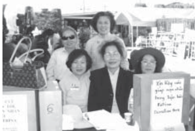
đầy tình đồng hương, đồng đạo.