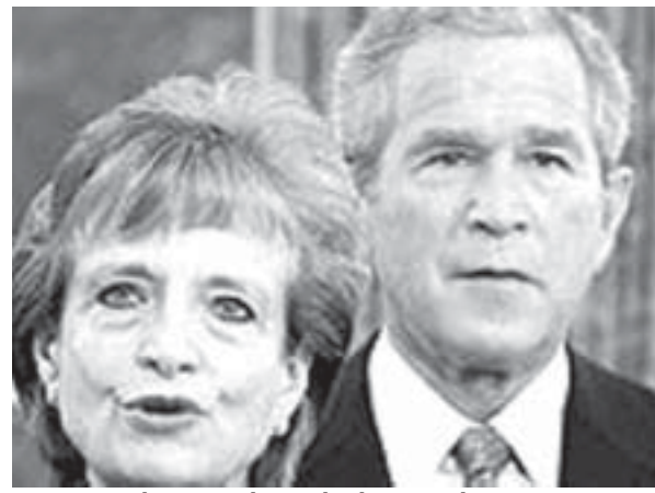
Việc bà Miers rút lui là đòn đau với ông Bush

Phe bảo thủ thuộc đảng Cộng hòa từng tỏ ra hoài nghi về vai trò của bà Miers tại Tối cao Pháp viện. Họ đặt câu hỏi về quan điểm của bà đối với các vấn đề như nạn phá thai, hay hiểu biết của bà về luật hiến pháp.