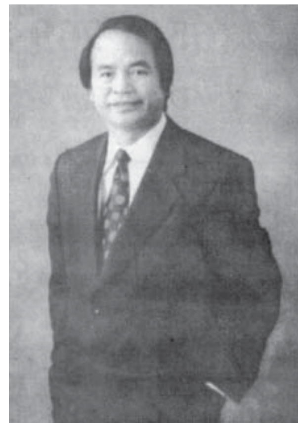
Real Estate Broker Investment Strategist

CHUYÊN MUA BÁN CÁC CƠ SỞ THƯƠNG MẠI TOÀN TIỂU BANG CALIFORNIA