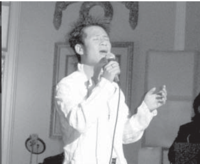
Bằng Kiều: Xuất thân qua bài “Tơ Giăng Giữa Đời”