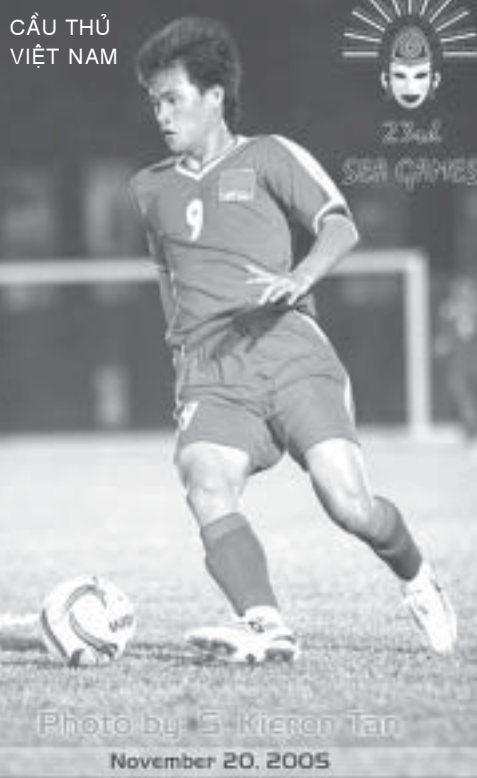
CẦU THỦ VIỆT NAM