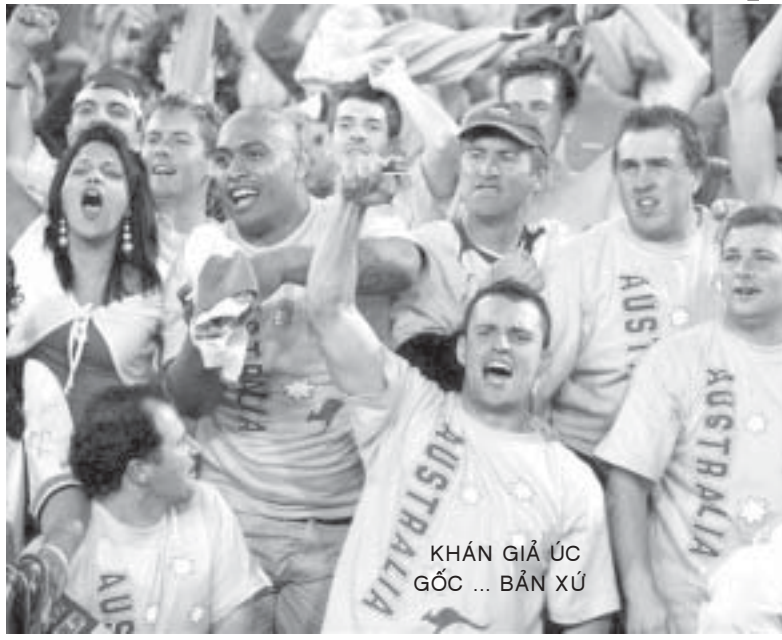
KHÁN GIẢ ÚC GỐC ... BÁN XỨ

Người Việt ở Úc chắc chắn đến sân vận động là để ủng hộ cho đội Úc, bởi họ đã mang cờ Úc, mặc áo vàng có huy hiệu nước Úc và vẽ trên mặt hai màu xanh vàng, là màu áo và quần của đội tuyển xứ "chuột túi". Người Úc biết dân "tóc đen" cũng là gà nhà nên đã đối xử rất niềm nở và thân ái, khác hẳn với vẻ mặt và hành động dè dặt khi trông thấy bất kỳ ai