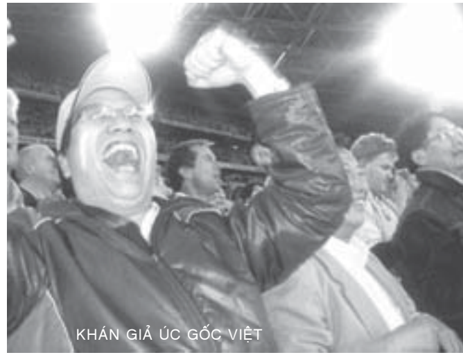
KHÁN GIẢ ÚC GỐC VIỆT

(Sydney) 20.11.2005. Cả nước Úc đã rung rinh như bị địa chấn, sau khi đội tuyển túc cầu quốc gia Úc hạ gục đội tuyển Uruguay bằng những cú đá phạt luân lưu sau 90 phút thi đấu chính thức, và 30 phút đá thêm trong hai hiệp phụ. Ở lượt đi, đội Uruguay đã thắng Úc 1-0, và tối thứ Tư 16 tháng 11 vừa qua, trên sân Telstra ở Sydney đội Úc đã gỡ lại được 1-0 ở phút thứ 35, nhưng sau đó không ghi được thêm bất cứ bàn thắng nào khác.