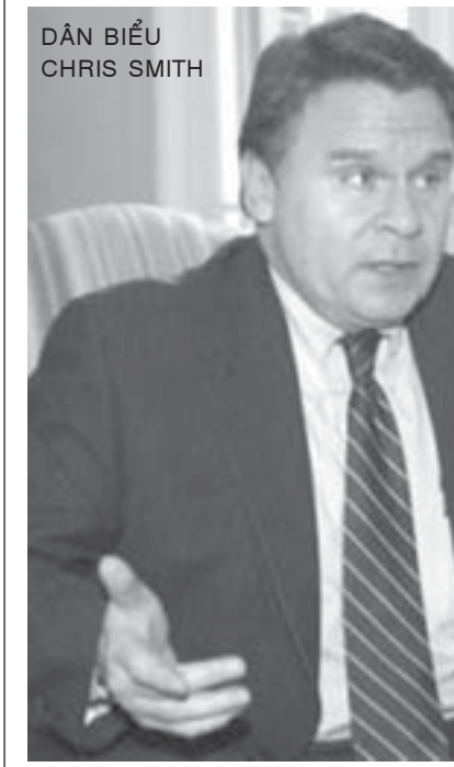
DÂN BIỂU CHRIS SMITH

(VOA) 05.12.2005. Dân Biểu Chris Smith, Chủ Tịch Ủy Ban Nhân Quyền Toàn Cầu của Hạ Viện Hoa Kỳ tuyên bố PHẢI LIÊN KẾT VIỆC XIN GIA NHẬP TỔ CHỨC THƯƠNG MẠI THẾ GIỚI WTO VỚI THÀNH TÍCH NHÂN QUYỀN CỦA CS VIỆT NAM.